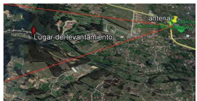
IMAGEN 2. Localización

Como bien se infiere del marco jurídico vigente y de los antecedentes a nivel latinoamericano antes descritos, para no incurrir en graves violaciones a los derechos de las personas, se deben seguir los procedimientos establecidos tanto en el COIP como en las normas administrativas, estas son: el “Reglamento del SICOM”, el “Manual de Cargos y Funciones”, en el cual se dan disposiciones referente al talento humano que trabaja en el Subsistema de Interceptaciones Telefónicas, conforme a sus competencias y responsabilidades, finalmente hay que citar como norma integradora al “Manual de Procedimientos e Instructivo de Entrega de Información”, en el cual se hace referencia estrictamente a la sinopsis y transcripciones elaboradas por los Analistas de Comunicaciones, con información relevante para el caso investigado, a fin que con indicios relevantes, la Fiscalía pueda solicitar órdenes judiciales para efectuar otras interceptaciones a nuevos abonados, que surgen dentro del ciclo de inteligencia en el análisis de las comunicaciones.