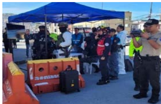
Fuente: Jairo Bolaños, Grupo de Operaciones Especiales. Elaboración: por el autor.