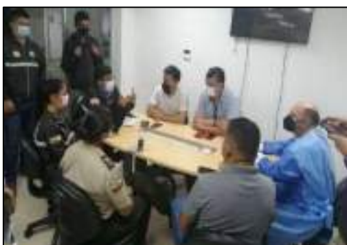
Elaboración: por los autores, 2021.

Mesa técnica de coordinación conformada por diferentes servicios especializados de la Policía Nacional