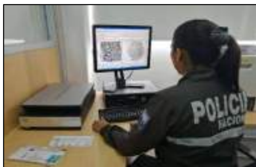
Elaboración: por los autores, 2021

Perito de Identidad Humana efectuando el Cotejo Papioscópico para alcanzar la identificación técnica de los cadáveres.