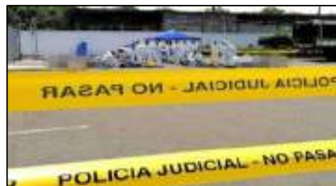
Elaboración: por los autores, 2021.

Parte posterior de la Jefatura de Medicina Legal DMG, donde se efectuó el manejo de cadáveres para la toma de necrodactilias.