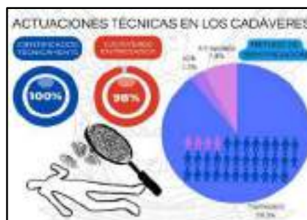
Elaboración: por los autores, 2021

Actuaciones técnicas en los cadáveres PPL registrados en septiembre de 2021 en la Penitenciaría del Litoral