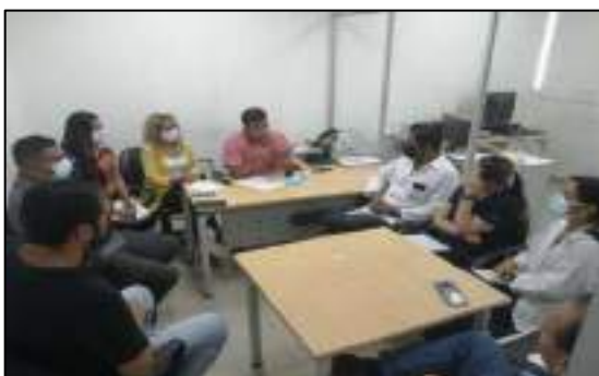
Elaboración: por los autores, 2021.

Reunión de evaluación de resultados con instituciones involucradas en la investigación de las muertes suscitadas en los centros carcelarios.