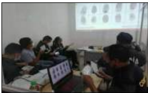
Elaboración: por los autores, 2021.

Equipo de identificación de cadáveres durante el cotejo manual y visual de las necrodactilias con las tarjetas biométricas del Registro Civil